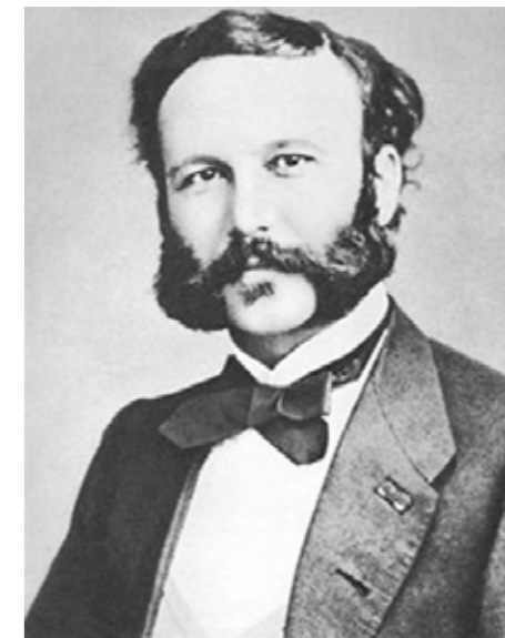
红十字国际委员会创始人之一——亨利·杜南先生。

“杜南之问”很快有了答案，次年，红十字国际委员会应运而生。经过150多年发展，红十字成为一种精神、一面旗帜。面对频发的人道主义危机，我们应该弘扬人道、博爱、奉献的精神，为身陷困境的无辜百姓送去关爱，送去希望，应该秉承中立、公正、独立的基本原则，避免人道主义问题政治化，坚持人道主义援助非军事化。”